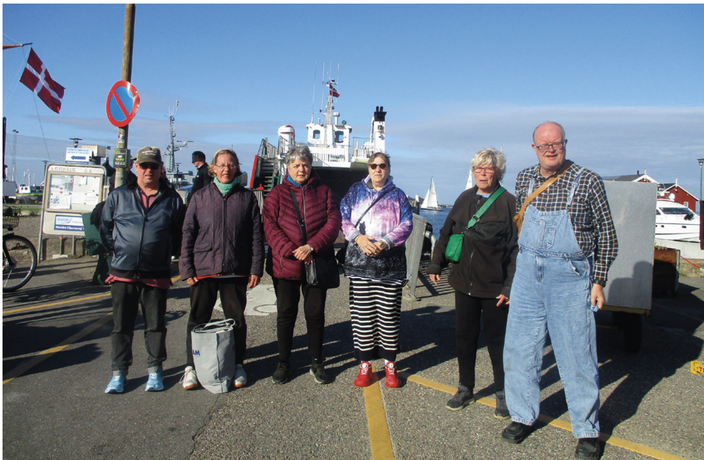
Alle mand klar til nye oplevelser. Til lands, til vands og ....