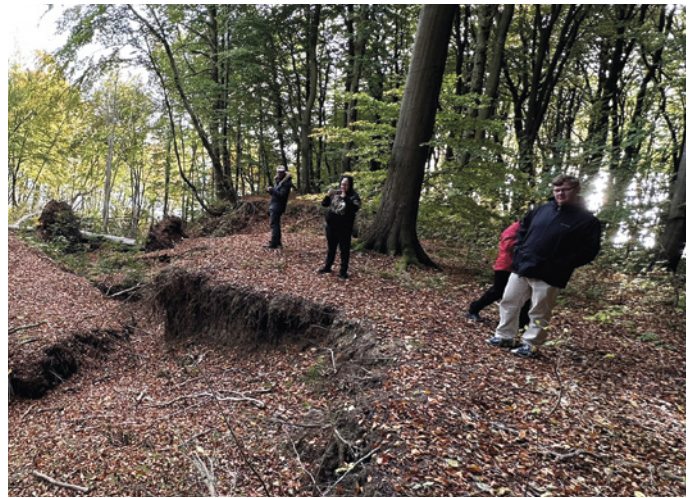
"Hyttefar" (spejderhyttens ejer) var med hele vejen og viste deltagerne, hvor de skulle passe på at gå.

Spejdeturen strakte sig over fire dage, og der blev både drejet kuglepenne og kastet med flødeboller. I begyndelsen blev der bare skudt bolde afsted, men til sidst røg flødebollerne også gennem luften og fik flokken til at grine. Næste tur bliver nok i forsommeren. Når det bliver mere lyst og varmt. Men også i kulde og mørke var det altså fedt at være afsted med verdens bedste fællesskab.