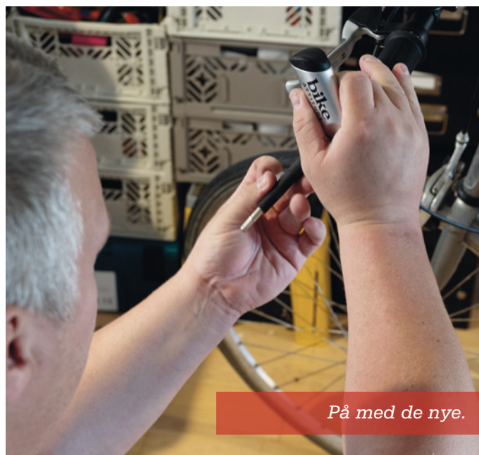
På med de nye.