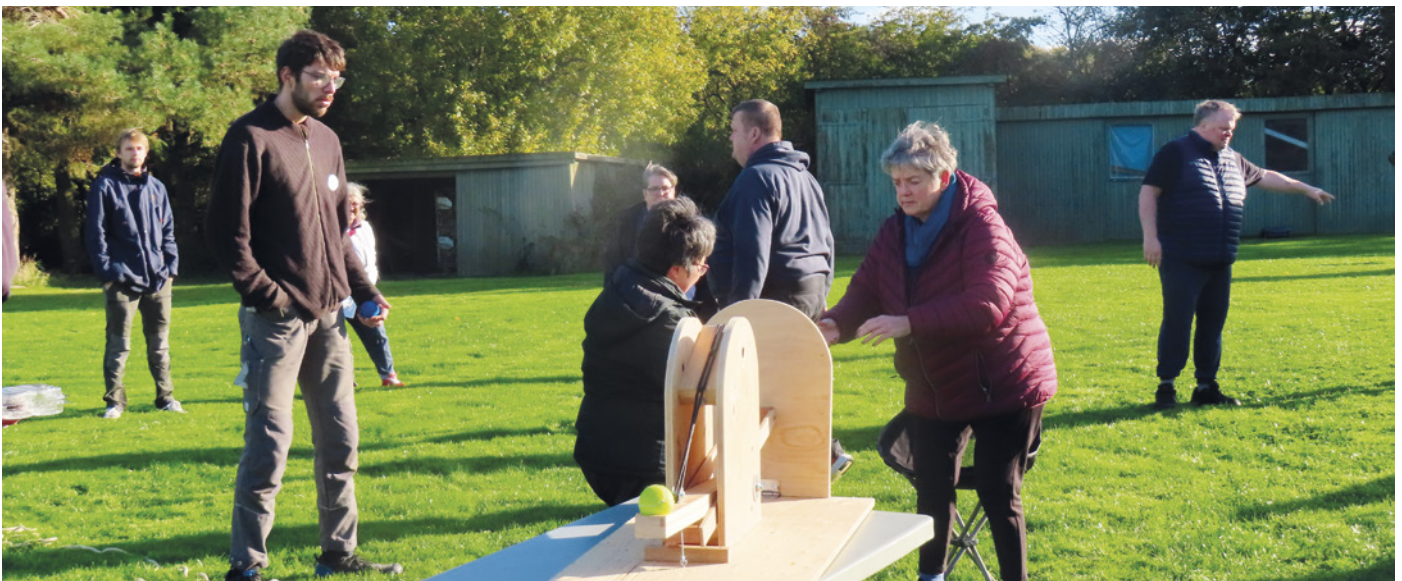
Flødebollekatapulten skød først med tennisbolde – senere blev der også skudt flødeboller afsted.