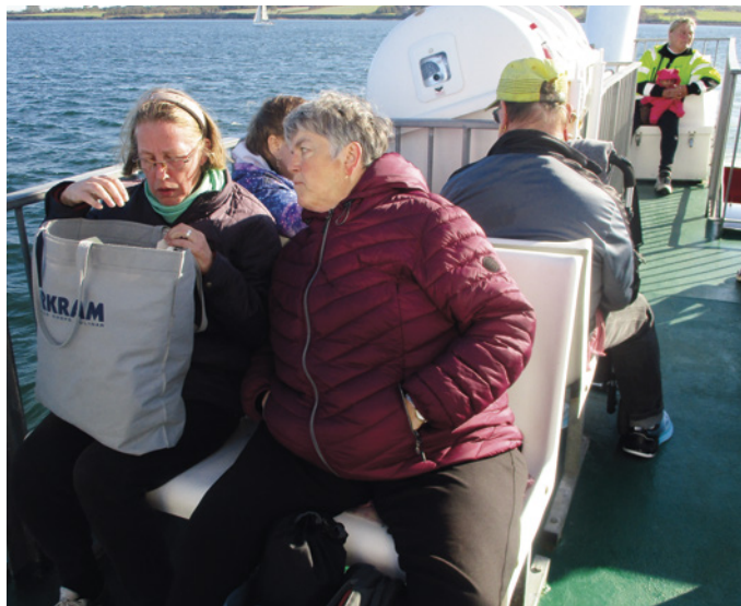
Færgeturen med "Ida" kostede 59 kr. pr. næse.

"Jeg mødte blandt andet en gammel ven fra Odense. En jeg ikke havde set længe," fortæller hun.