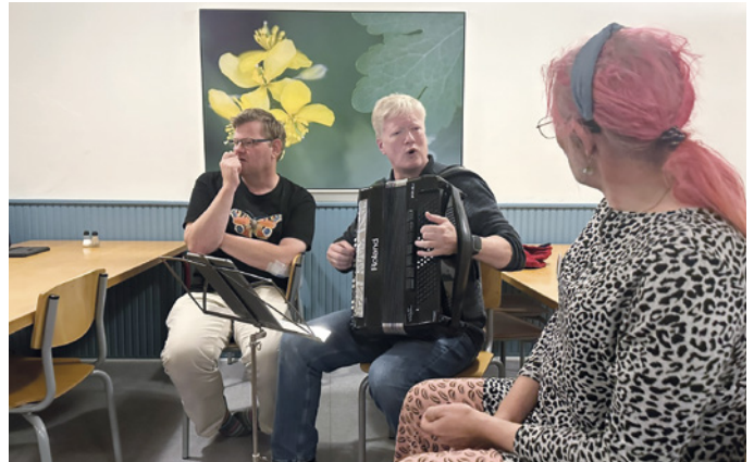
Som en overraskelse kom der også lige en harmonikaspieler forbi. Og så blev der ellers spillet op til fællessang.