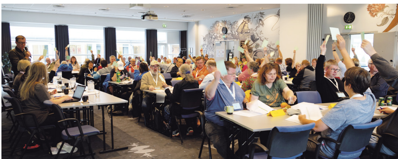
Afstemninger foregik ved håndsoprækning. Alle stemmeberettigede havde fået en grøn seddel.