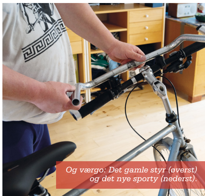
Og værigo: Det gamle styr (øverst) og det nye sporty (nederst).

På billederne viser han, hvordan han sætter nye greb på sit styr.