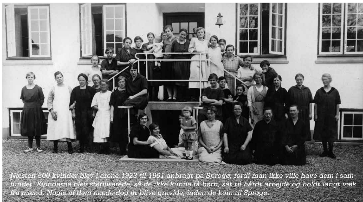
Næsten 500 kvinder blev i årene 1923 til 1961 anbragt på Sprogø, fordi man ikke ville have dem i samfundet. Kvinderne blev steriliserede, så de ikke kunne få børn, sat til hårdt arbejde og holdt langt væk fra mænd. Nogle af dem nåede dog at blive gravide, inden de kom til Sprogø.

”Man kan også få hjælp fra Børns Vilkår til at finde papirer om sin sag. Det er det, man kalder akt-indsigt. Mange overgreb er nemlig dokumenteret skriftligt,” siger hun.